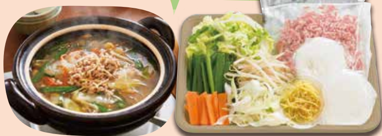
お料理セット (たっぷり野菜と春雨の具沢山スープセット)