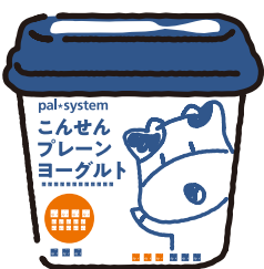
こんせん プレーンヨーグルト