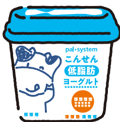
こんせん プレーンヨーグルト(低脂肪)