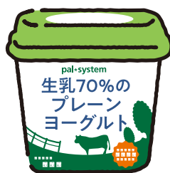
生乳70%の プレーンヨーグルト