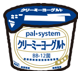
クリーミーヨーグルト 75g