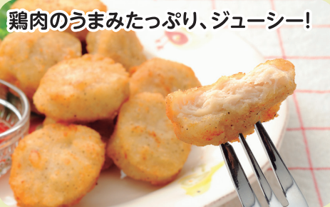
鶏肉のうまみたっぷり、ジューシー!