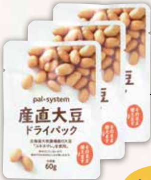
産直大豆 ドライパック