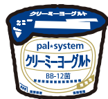
クリーミーヨーグルト 75g