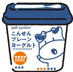
こんせん プレーンヨーグルト