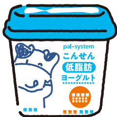
こんせん プレーンヨーグルト(低脂肪)