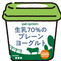
生乳70%の プレーンヨーグルト