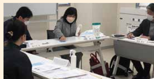
2/26(日)内野まちづくりセンター